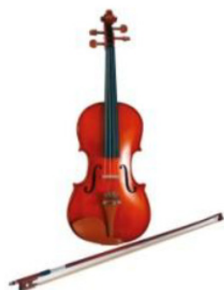
Carmine Gaudieri, Violino