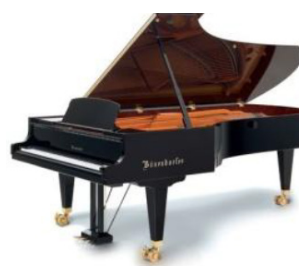
Simonetta Bisegna, pianoforte