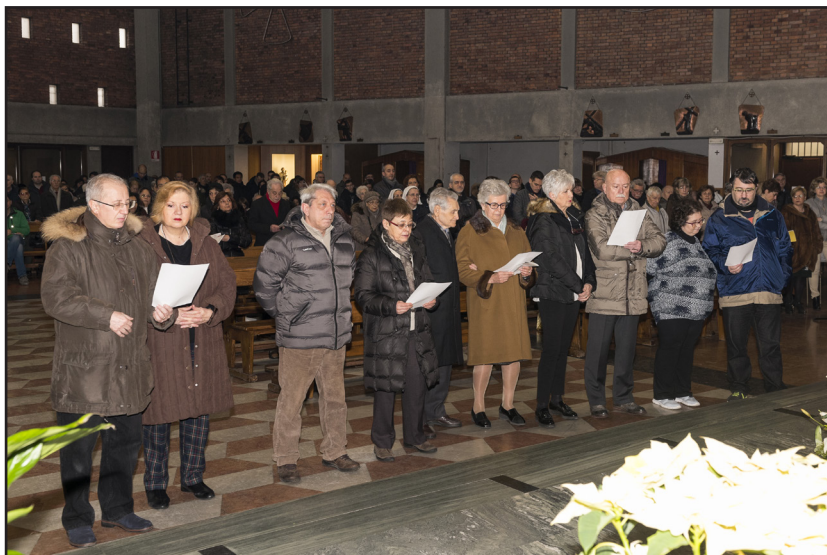
Ricordo Anniversari di Matrimonio durante la S. Messa delle 10.00