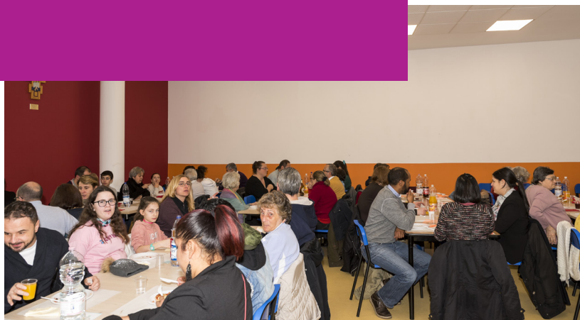
Pranzo insieme durante la Festa della Famiglia