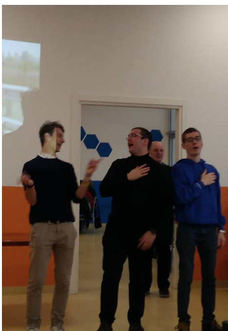
Momento di animazione pomeridiano con balli e karaoke