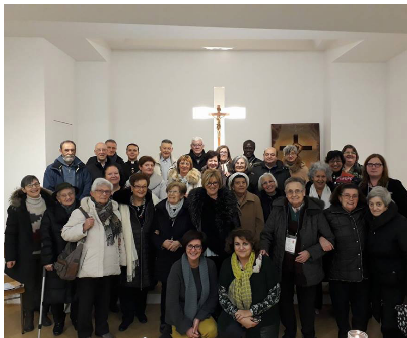
Famiglia della croce Parrocchia Santa Maria Liberatrice

Alleanza d'Amore con il Sacro Cuore di Gesù